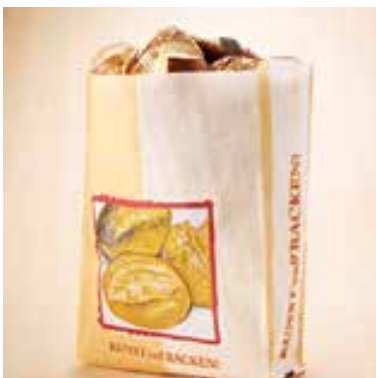
Der Carrybag bietet Platz für ca. 15–20 Brötchen. Alternativ können in ihm auch ein Brot und eine Auswahl gemischter Brötchen, zwei Partysonnen uvm. verpackt werden.