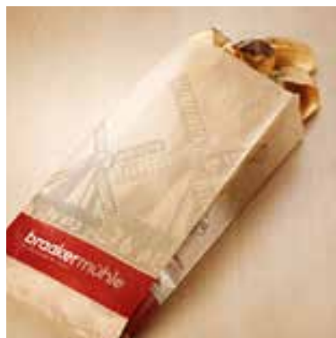
F23 ist unser kleinster Verkaufshit. In braunem Papier unterstreicht er die biologische, regionale oder naturverbundene Ausrichtung Ihres Unternehmens.